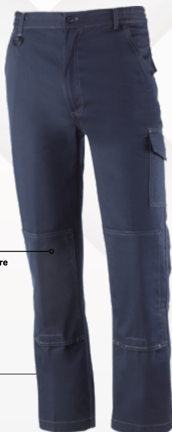
839BL Bleu marine Navy blue